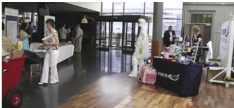
I tillegg til foredragene var det utstillinger for HMS-tjenester, verneutstyr o.l. fra Würth Norge, VWR International, Teknologisk Institutt, Info Tjenester, ACO Norge og ECOonline.

Neste års kjemikalieseminar er berammet til 9.-10. juni 2009 og vil i god tid bli annonsert på ECOonline's hjemmeside.